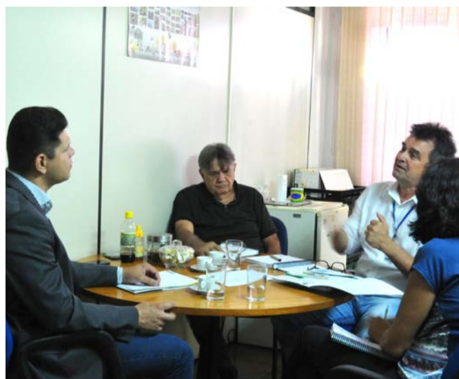
Parceria busca desburocratização de financiamento