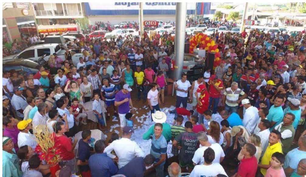
Mutidão acompanhou de perto o sorteio

Como é de costume em outros eventos de premiação da rede A3P, o esperado sorteio de Natal foi acompanhado por centenas de populares, que compareceram em peso com a esperança de levar para casa o mais valioso prêmio da roda de sorteios: Uma moto Honda 0 Km no valor de R$ 12 mil. Os outros nove prêmios